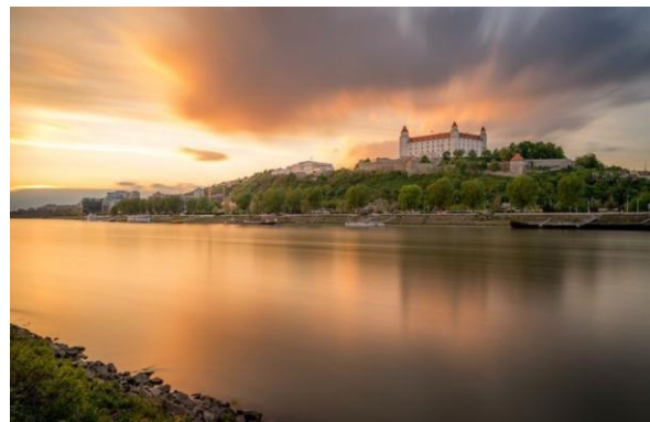
Danubio e Bratislava